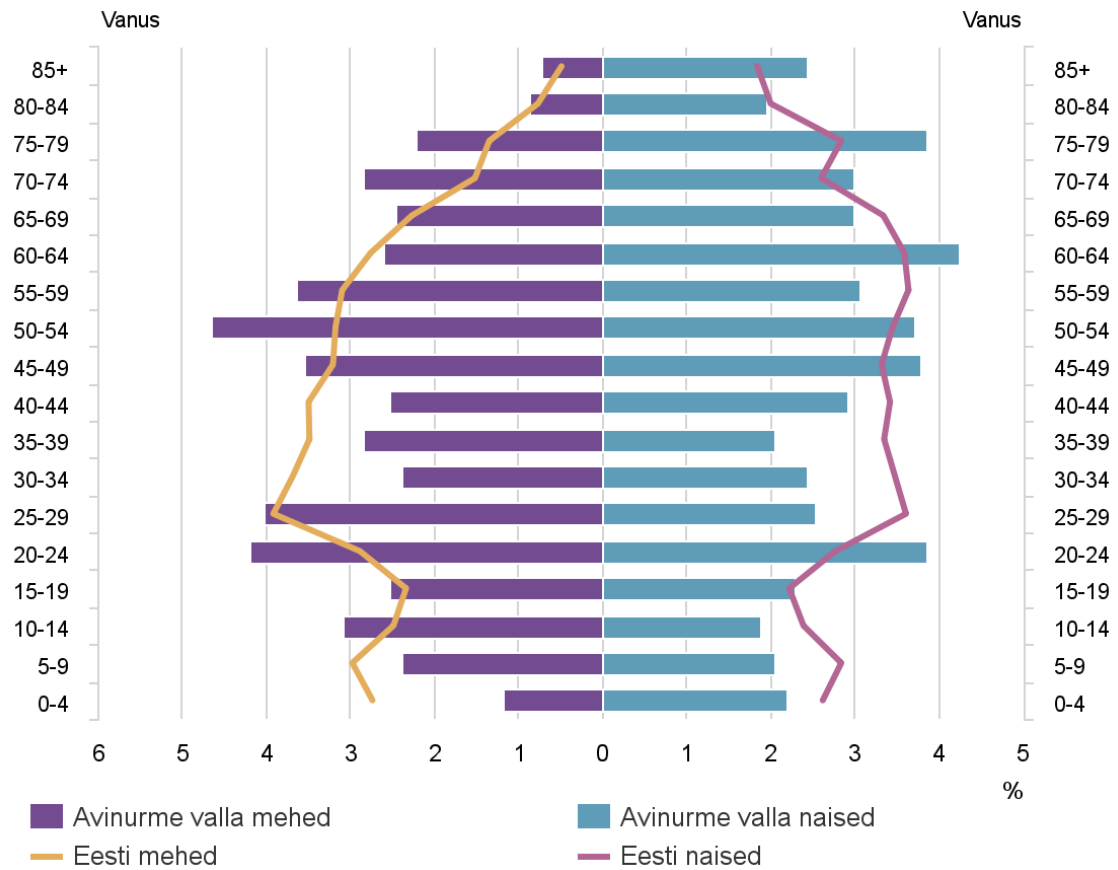
Joonis 1. Valla rahvastiku koosseis

Avinurme valla rahvaarv kahaneb (vt joonis 2). Statistikaameti andmetel on valla rahvaarv perioodil 2012-2015 vähenenud keskmiselt 24 inimese võrra aastas ning seda peaaugalt madala iibe tõttu. Kahanemist ei mõjuta oluliselt rahvastiku rändeprotsessid, kuna sisse- ja väljaränne on 2012-2015 olnud peaaegu võrdne. Kuigi valla rahvastik on Statistikaameti andmetel 2015-2016 perioodil kasvanud 20 inimese võrra, on kaugeleulatuvate järelduste tegemine veel ennatlik.